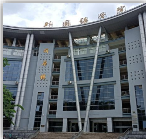
跃进南分馆所在楼 分馆位置：A-704