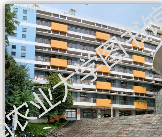
东区分馆所在楼 分馆位置：教四一楼和三楼